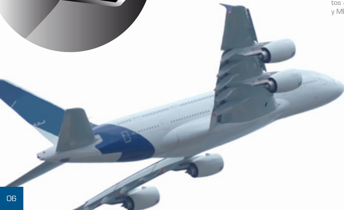
Body gap covers